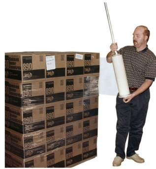
Fig. 2 Figura 2