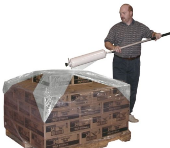
Fig. 4 Figura 4

For high skids, you may switch the dispenser into the upright position with your right hand near the handbrake as seen in Fig. 3 . Tilt the dispenser slightly forward so that the film being applied is holding the bulk of the weight, not your arms.