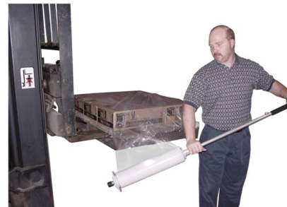
Fig. 5 Figura 5

Para paletes altos, puede cambiar el dispensador en posición vertical con la mano derecha cerca del freno de mano como se ve en la Figura 3 . Incline el dispensador ligeramente hacia adelante para que el plástico que esta siendo aplicado esta sosteniendo la mayor parte del peso, no sus brazos.