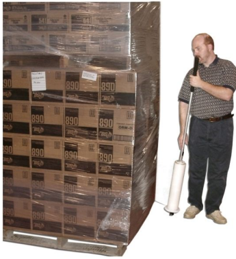
Fig. 1 Figura 1