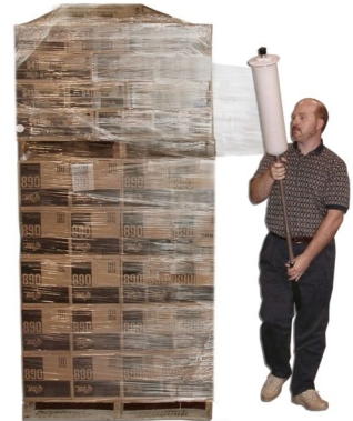
Fig. 3 Figura 3